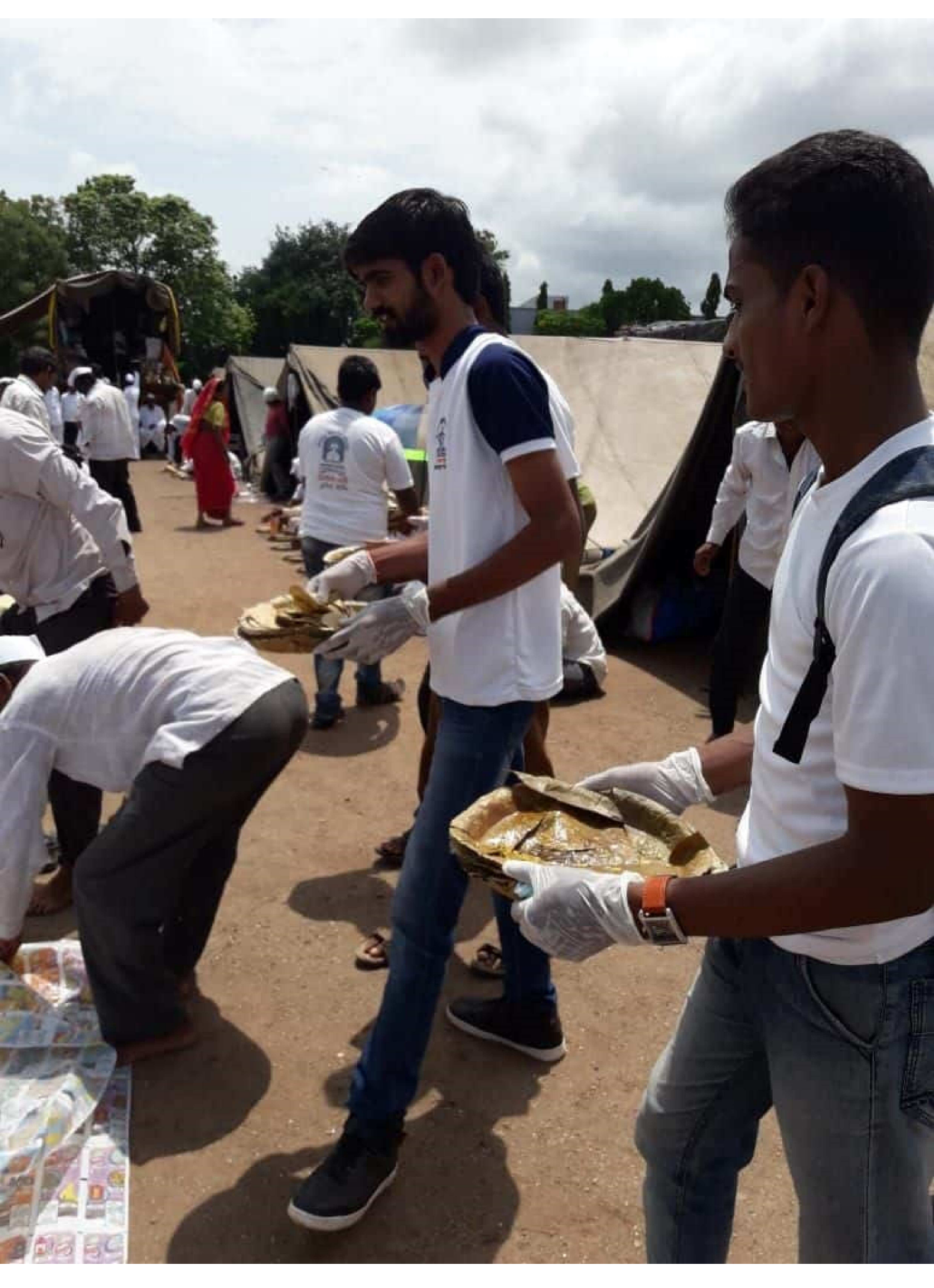
Scanned by CamScanner