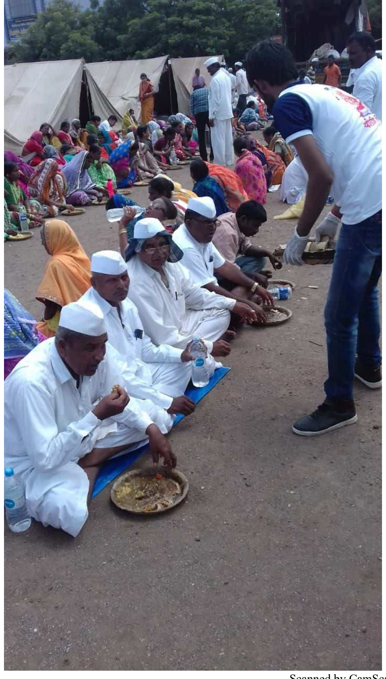
Scanned by CamScanner